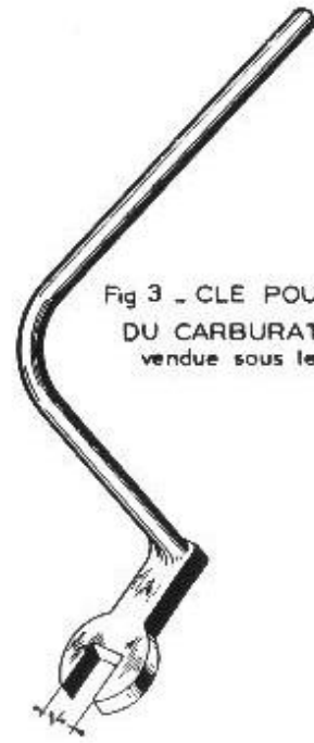
Fig. 3 - CLE POUR FIXATION DU CARBURATEUR DE 32 vendue sous le n° 1622-T